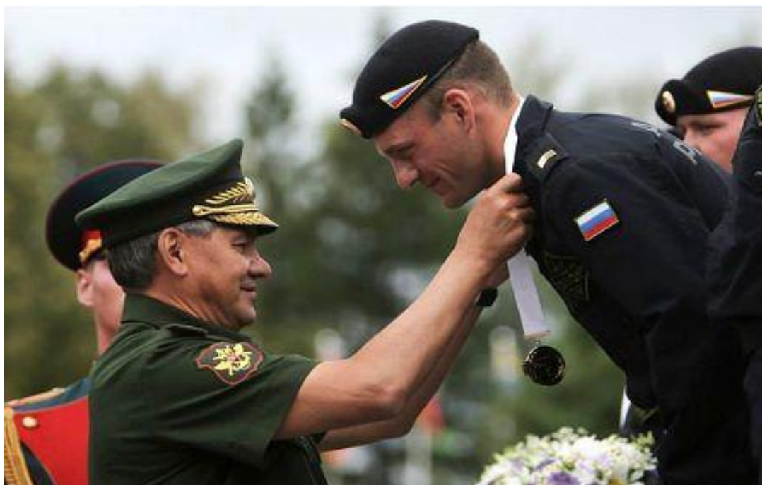
Сергей Шойгу награждает команду танкистов.