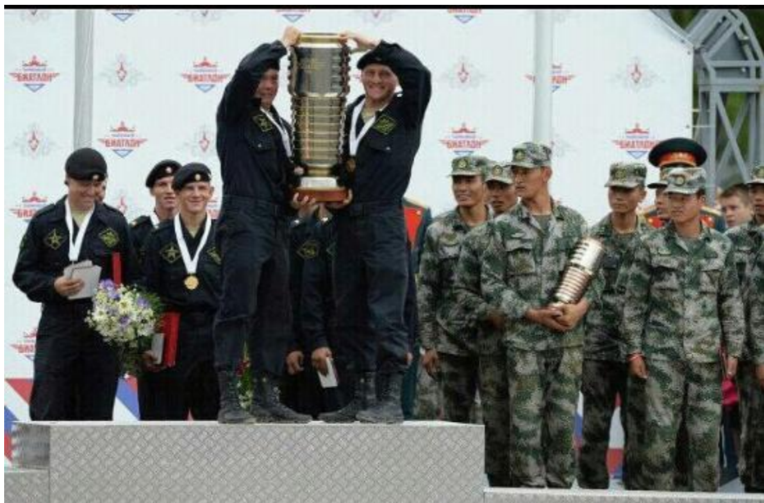
Вот награда Российских танкистов в танковом биатлоне.