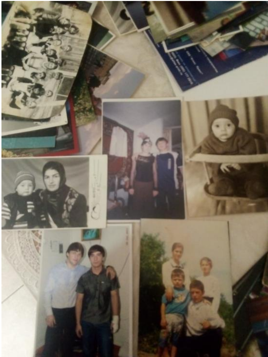
Фотографии из семейного альбома